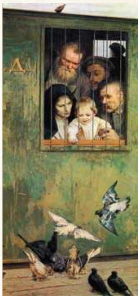
Всюду жизнь. Н. Ярошенко, 1888

Урожай зерновых хлебов давал около двух миллиардов пудов в год для европейской России. За границу вывозилось около одной пятой