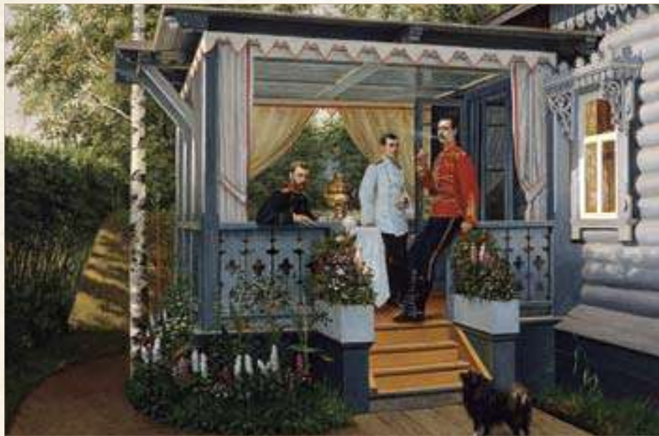
Великий князь Сергей Александрович, цесаревич Николай Александрович и великий князь Павел Александрович в Царском Селе. Н. Дмитриев-Оренбургский. Конец 1880-х

Эта тщательная и планомерная подготовка к исполнению обязанностей монарха не была доведена до конца вследствие ранней смерти императора Алек-