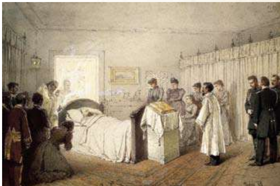
Смерть Александра III в Ливадии. М. Зичи, 1895

Наука отдаст Императору Александру III подобающее место не только в истории России и всей Европы, но и в русской историографии, скажет, что Он одержал победу в области, где всего труднее достаются эти победы,