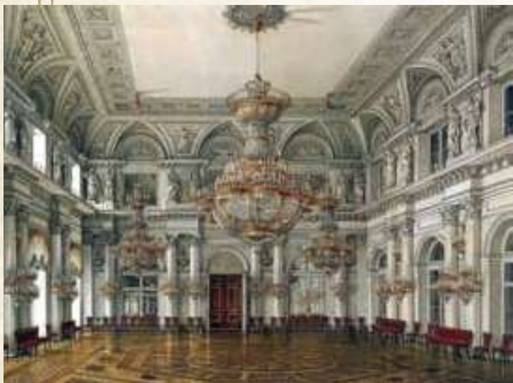
Виды залов Зимнего дворца. Концертный зал. К. Ухтомский, 1865

Финансы России после пятнадцати лет мира оправились от потрясения войны 1877–1878 гг. Кредитный рубль держался в течение ряда лет на высоте двух третей своего номинального курса. Правительство, заключая заграничные займы в золоте и тратя внутри страны кредитные рубли, накапливало значительный золотой запас для проведения стабилизации рубля. Пост министра финансов с 1892 г. занимал С. Ю. Витте.